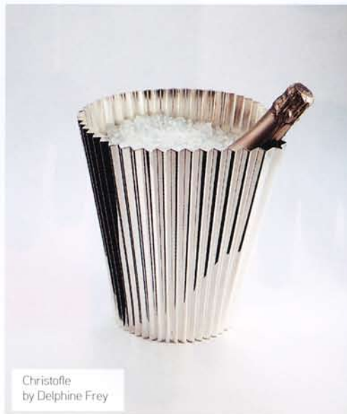
Christofle by Delphine Frey