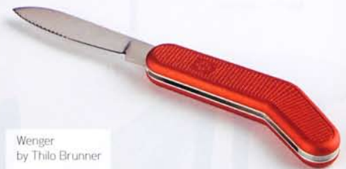
Wenger by Thilo Brunner