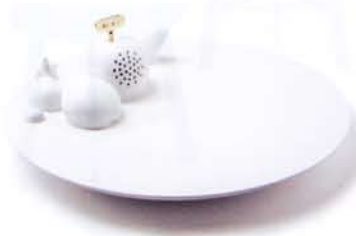
Reuge by Philippe-Albert Lefebvre

Luxury is an undeniably Swiss theme and the foreseeable esthetic questioning will collapse faced with the shine of its accomplishments. Refined, as perfectly useless as they pretend to refuse laziness, they are small excessive vestals at the pantheon of design. We love the follies in the same manner as we exalt the creatures that embody fashion: for their capacity for extraterrestrial grace and their talent for doing nothing. When that is successful, a form of aristocracy, in the noblest sense of the term.