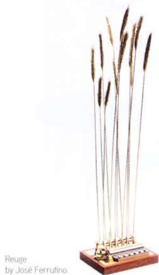
Reuge by José Ferrufino