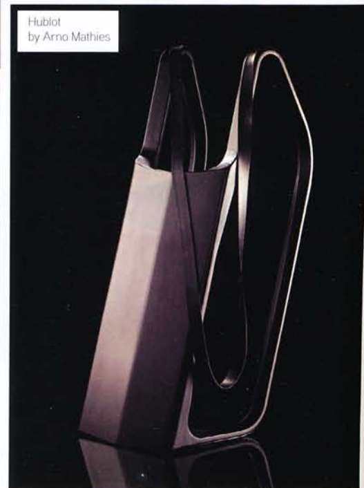
Hublot by Arno Mathies