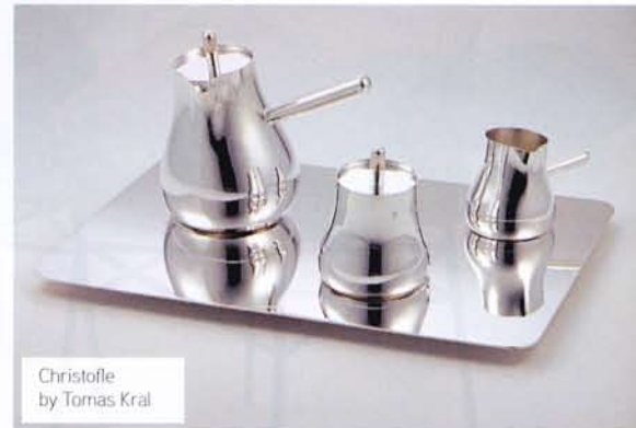
Christofle by Tomas Kral