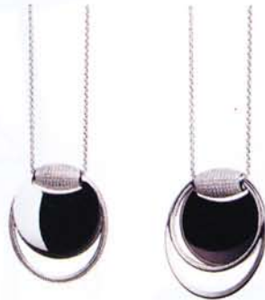
Audemars Piguet by Samuel Arredondo